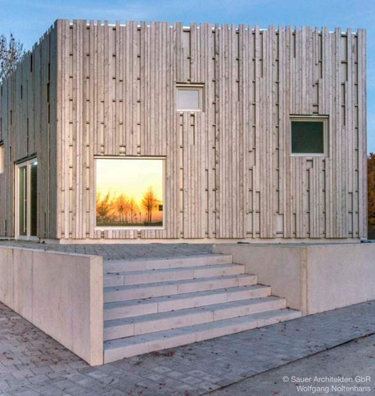
© Sauer Architekten GbR Wolfgang Noltenhans